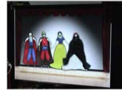
사용자가 만드는 STORY