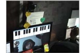
영상 센싱 INTERACTION _ MAX/MSP JITTER