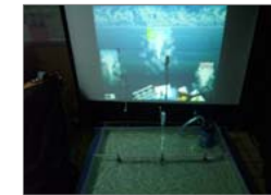
실제 분수와 가상분수를 이용한 인기투표결과 디스플레이