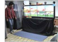
사용자 움직임에 반응하는 인터랙티브 타일드 디스플레이