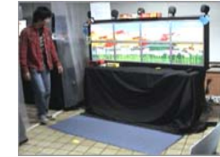
사용자 움직임에 반응하는 인터랙티브 타일드 디스플레이