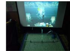
실제 분수와 가상분수를 이용한 인기표결과 디스플레이