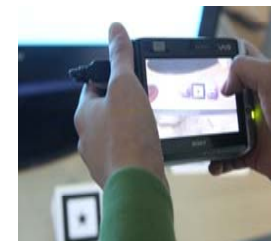
증강현실 기반 동영상 방명록 (osgART 사용)