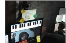
영상 센싱 INTERACTION _ MAX/MSP JITTER