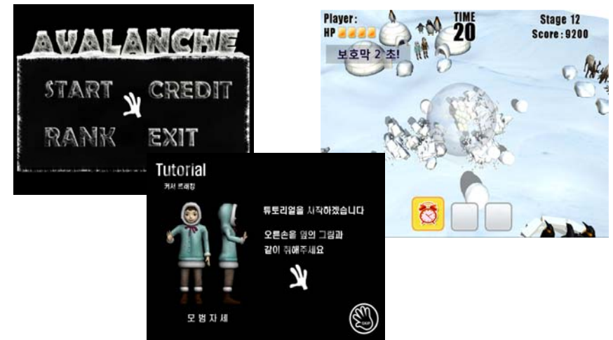
Avalanche (Kinect 센서를 사용한 전신 운동 게임)