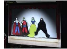
사용자가 만드는 STORY