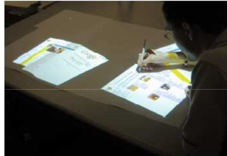
Figure 3: Collaborative web browsing using our distributed tabletop. The remote collaborator's artifacts are visible on the left at the edge of the table.