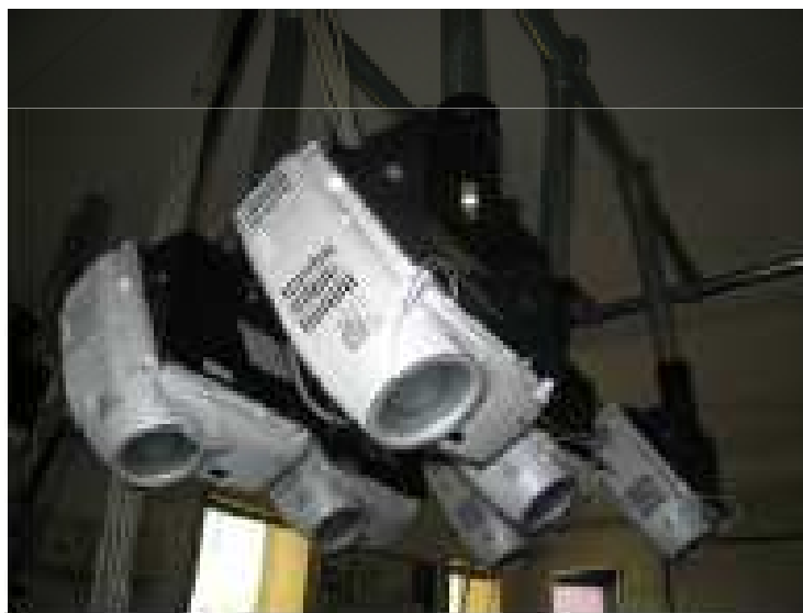
Figure 4: The T3 projected tabletop display.